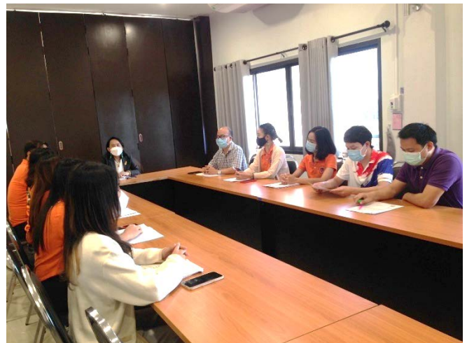
ภาพประกอบการประชุมคณะทำงานฯ ครั้งที่ ๒