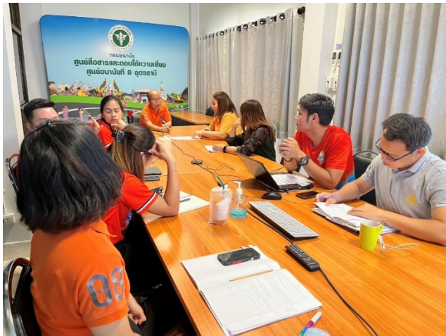
ภาพประกอบการประชุมคณะทำงานฯ ครั้งที่ 3

ได้มีการประชุมคณะทำงานฯ ครั้งที่ 3 เมื่อวันที่ 31 มกราคม 2567 ณ ห้องประชุมดอกจาง ศูนย์อนามัยที่ 8 อุดรธานี โดยมีวัตถุประสงค์เพื่อติดตามการดำเนินงานแผนขับเคลื่อนการดำเนินงานตัวชี้วัดที่ 2.1 ระดับ ความสำเร็จของการดำเนินงานคุณธรรมและความโปร่งใส (Integrity and Transparency Assessment : ITA) ประจำปีงบประมาณ พ.ศ. 2567