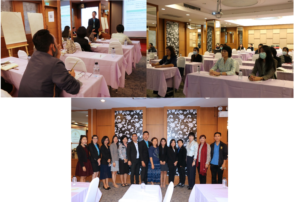
กิจกรรมที่ ๕.๒ พัฒนาให้มี Admin กำกับติดตามผลการสำรวจพฤติกรรมในระดับเขต จังหวัดและอำเภอ ผลการดำเนินงาน

https://docs.google.com/spreadsheets/u/๕/d/๑๒zNfRHQgRTcjXMmhH_ExL๘lvhue๔gy๑p/edit?usp=drive_web&ouid=๑๐๗๐๑๐๐๒๘๐๒๗๐๑๓๖๖๖๘๗๕&rtppof=true